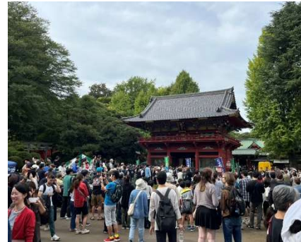
メイン会場の根津神社は、 沢山の人で大賑わい